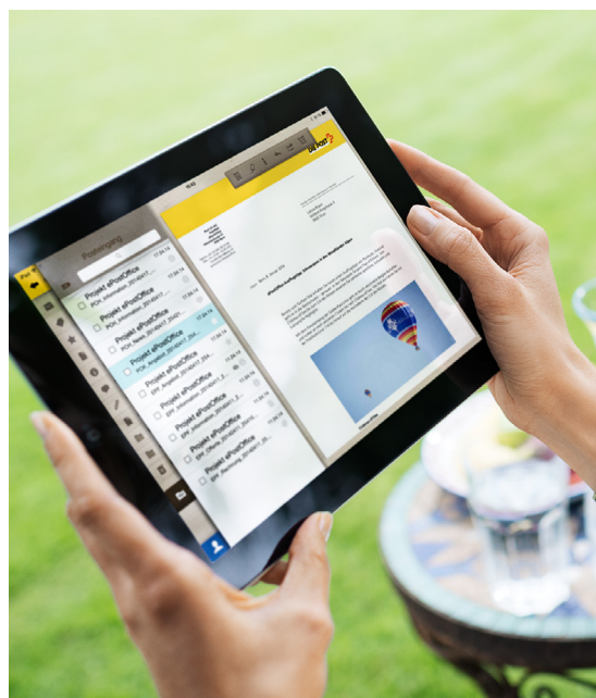
Greifen Sie jederzeit und überall auf Ihre Post zu.

E-Post Office bietet Ihnen im Abo einen kostenpflichtigen Scan-Service an, bei dem die Post Ihre Sendungen automatisch einscannet und in E-Post Office zur Einsicht, Bearbeitung und Archivierung zur Verfügung stellt.